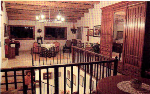
IX. Imatge d'una zona de l'espai de golfes de la planta segona

La planta segona, amb una galeria amb petites obertures en forma d'arc, era la zona destinada a graner, on encara s'hi conserven les sitges originals destinades a guardar la collita durant l'hivern.