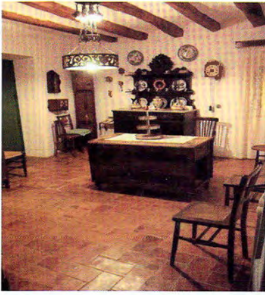
VI. Imatge d'un dels dormitoris principals