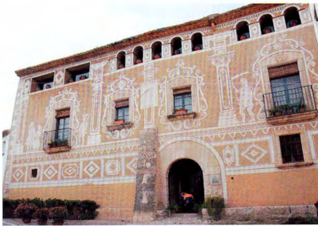
II. Imatge actual de la façana principal de Cal Gener

La casa pairal de tres plantes convida a l'accés per una portalada d'arc de mig punt amb pedra adovellada i retallada per la presència d'un contrafort. A la planta baixa, amb una tipologia arquitectònica molt tradicional i ben conservada, hi feien vida els masovers que conreaven les terres i arquitectònicament hi destaca el cub circular de grans dimensions on es trepitjava el raïm, el celler original amb el cub soterrat de peces ceràmiques vidrades on es recollia el vi, la cuina amb el foc a terra original i una pica de rentar de pedra d'una sola peça on es feia el procés de neteja de la roba amb cendres. Hi ha una capella amb unes pintures originals al fresc sense restaurar que podrien ser dels segles XVII-XVIII, que era l'antic oratori del poble abans que es construís l'església del Sagrat Cor (1880).