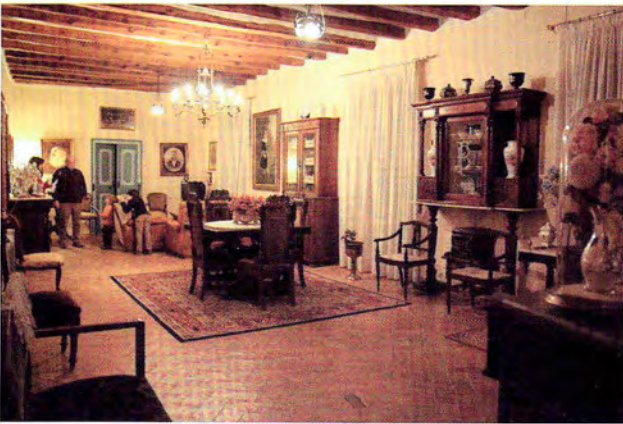
VIII. Imatge de la planta noble o principal de la casa

La planta segona, amb una galeria amb petites obertures en forma d'arc, era la zona destinada a graner, on encara s'hi conserven les sitges originals destinades a guardar la collita durant l'hivern.