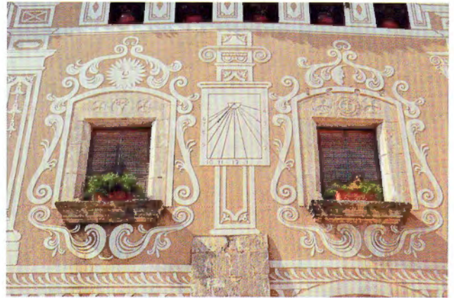
X. Imatge del rellotge de sol de la façana esgrafiada

faixa central té la representació iconogràfica més interessant amb cinc pilastres de diferents ordres que divideixen l'espai, amb molta ornamentació de caire floral, motius astrològics com una estrella, un sol, una lluna i una cara representant el vent coronat tot plegat per un fantàstic rellotge de sol. Quatre personatges decoren la façana amb indumentària cortesana afrancesada juntament amb la presència d'un militar de la infanteria lleugera del cos de voluntaris de Catalunya, que representa Antoni Gener, ministre de rendes reials, personatge relacionat amb els propietaris de la casa. Les obertures de finestres i balcons són de pedra tallada amb llindes esculpides amb diversos motius com una creu de Malta. La façana va ser restaurada l'any 1984 sota la direcció de l'arquitecte Joan Puig, que va realitzar una fantàstica tasca de recuperació dels dibuixos originals, que van ser de nou reproduïts en un nou esgrafiats realitzat pel mestre esgrafiador Jaume Amat, deixeble de Ferdinandus Serra, autor dels esgrafiats de la casa del gremi dels Velers de Barcelona, entre altres.