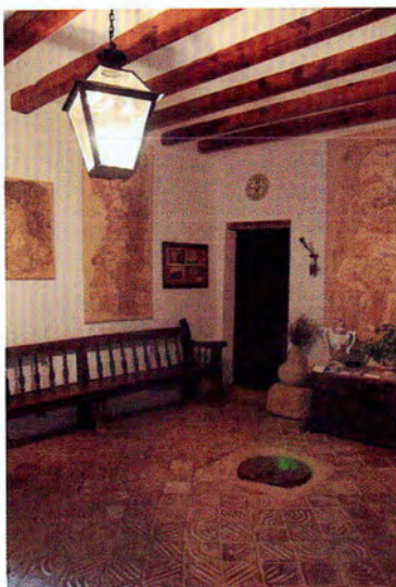
XI. Imatge de la porta adovellada d'accés