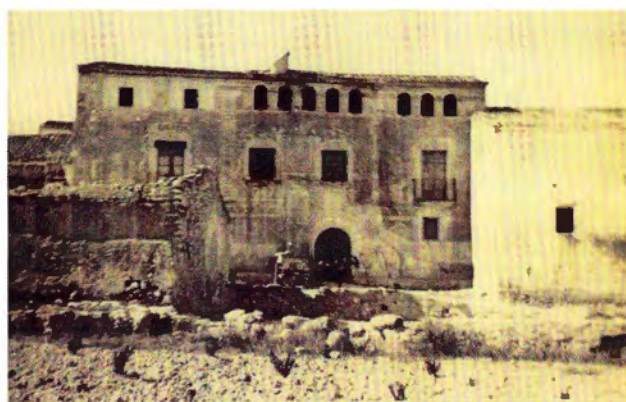
1. Imatge antiga de Cal Gener al segle XIX

Cal Gener o la Casa Gran de les Peces és un clar exemple de masia de dos cossos edificada sobre restes medievals dels segles XIII-XIV. Una de les reformes més importants portades a terme a l'edifici va ser l'any 1698, i una segona l'any 1778, dates esculpides a dues llindes de les finestres de la façana principal.